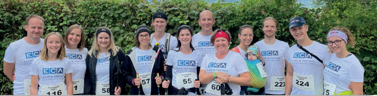
Unser begeistertes Kanzlei-Team mit Familienangehörigen beim Justizlauf am 2. Oktober 2021 in Klagenfurt